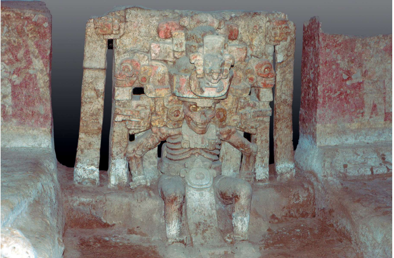
4. Een levensgrote, ongebakken kleisculptuur van Mictantecuhtli, de Heer van de Onderwereld, El Zapotal, Mound 2, Veracruz, Mexico.