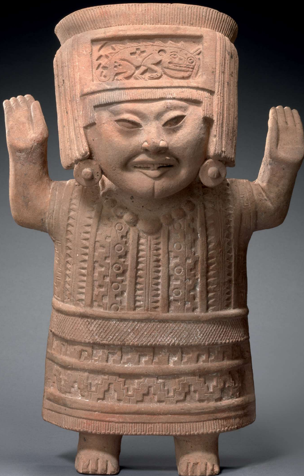
3. Een voorbeeld van de Nopiola-stijl: Staande vrouw met een tuniek met geometrische motieven. Aardewerk, h. 32 cm, b. 21,4 cm, d. 11,6 cm.

Nopiola- stijl, zuiden van Veracruz, Mexico. Laat-klasseieke periode 600-900 na Chr. MAS IB.2010.017.058 Collectie Paul & Dora Janssen-Arts, Vlaamse Gemeenschap Brussel, Foto: Hugo Maertens.