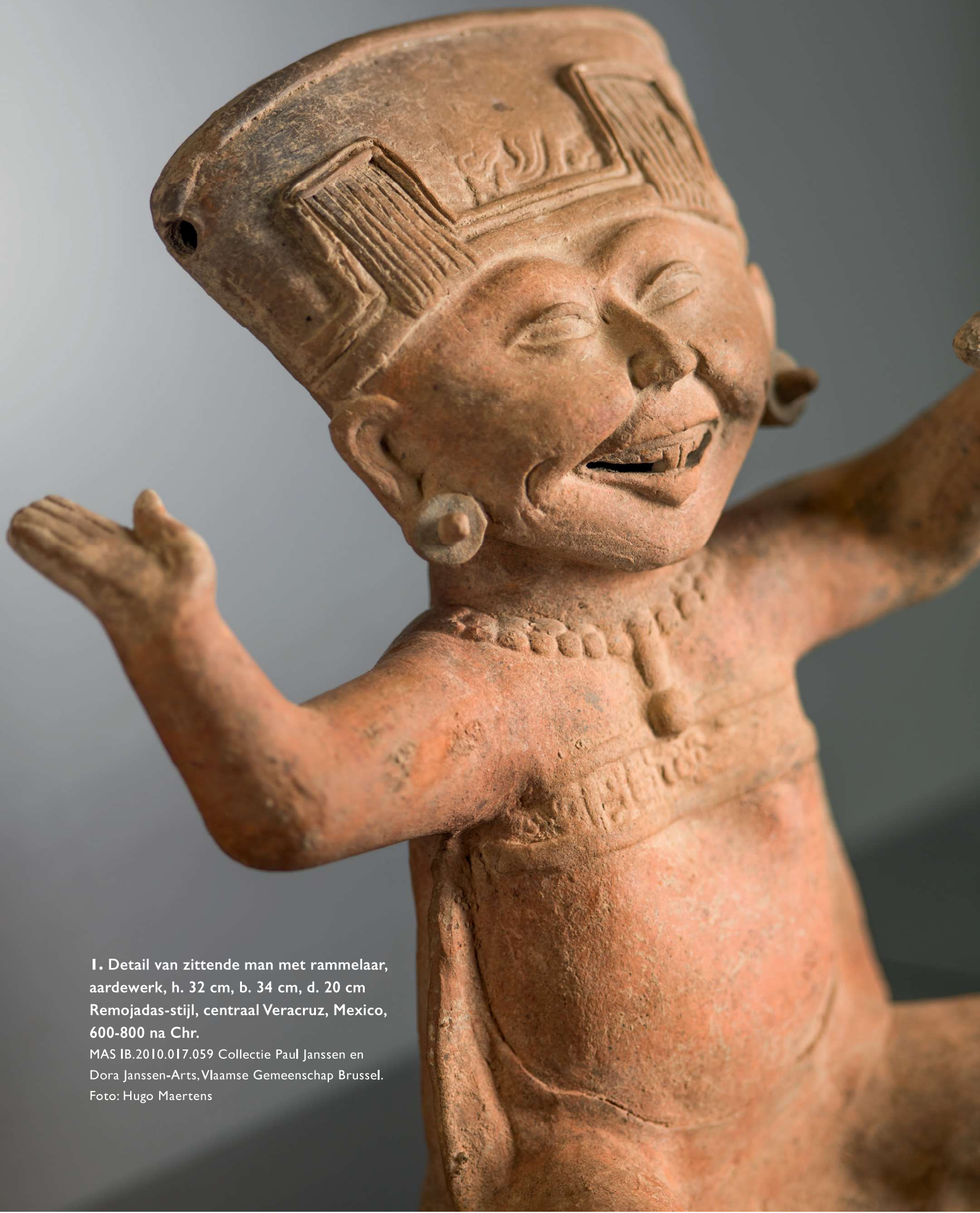
I. Detail van zittende man met rammelaar, aardewerk, h. 32 cm, b. 34 cm, d. 20 cm Remojadas-stijl, centraal Veracruz, Mexico, 600-800 na Chr.

MAS IB.2010.017.059 Collectie Paul Janssen en Dora Janssen-Arts, Vlaamse Gemeenschap Brussel.