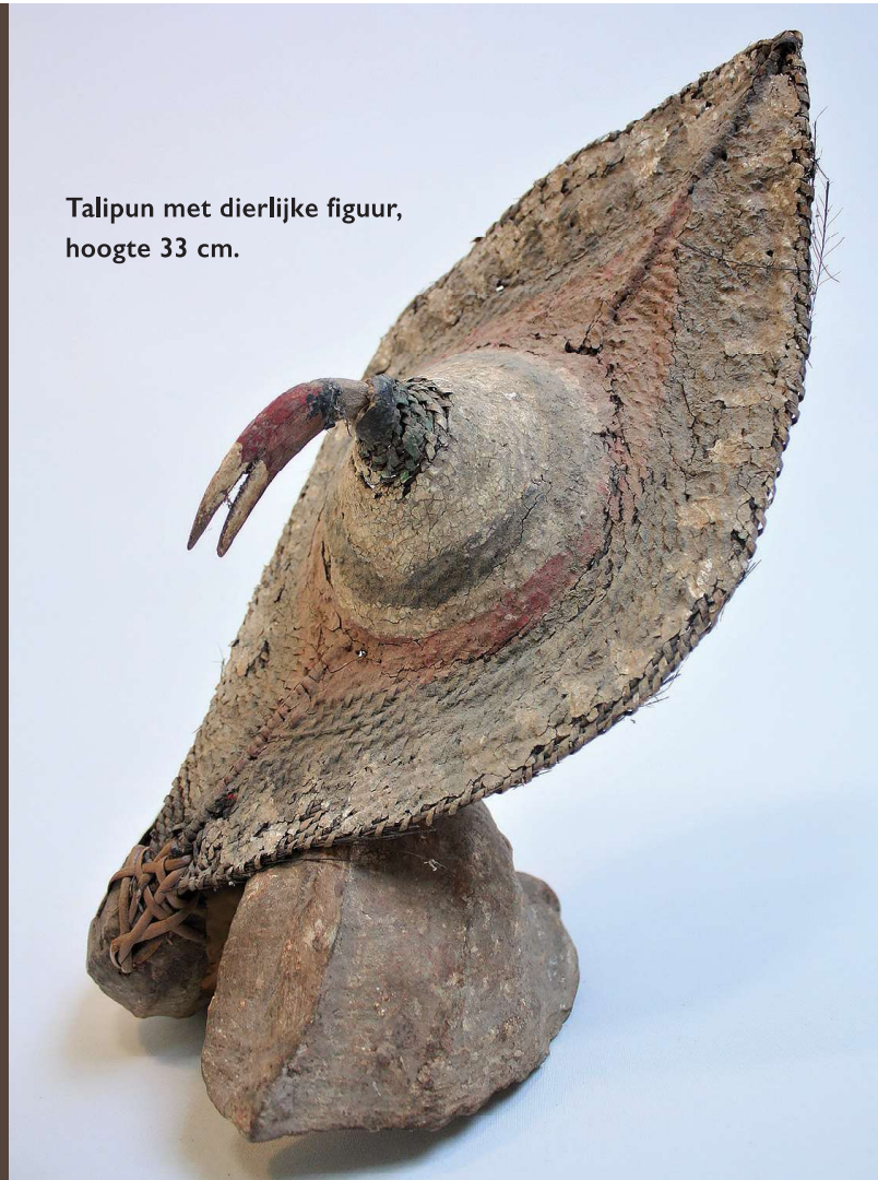
Talipun met dierlijke figuur, hoogte 33 cm.