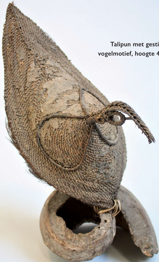
Talipun met gestileerd vogelmotief, hoogte 42 cm