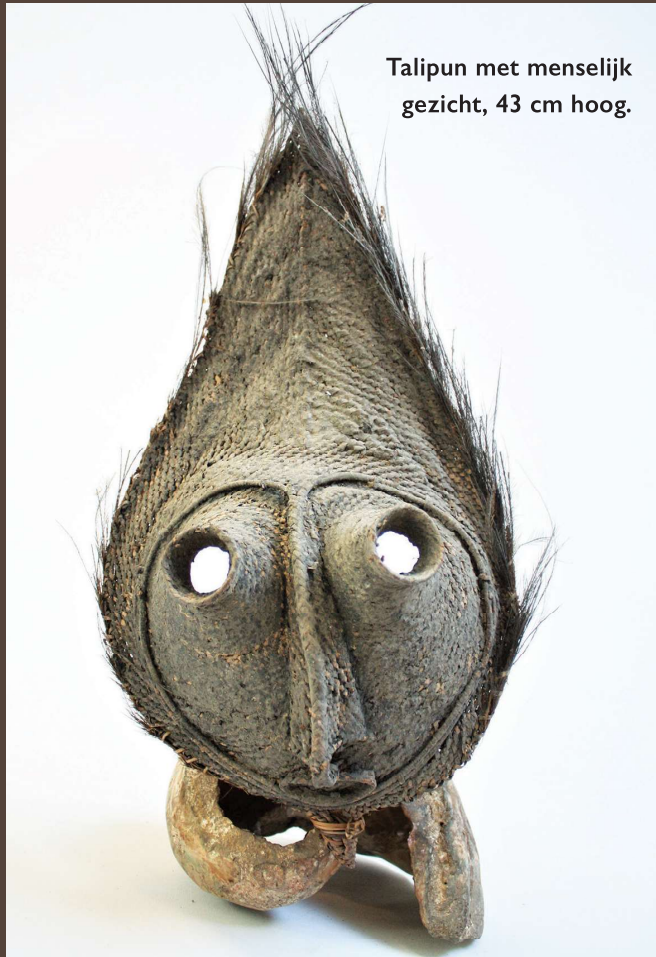
Talipun met menselijk gezicht, 43 cm hoog.