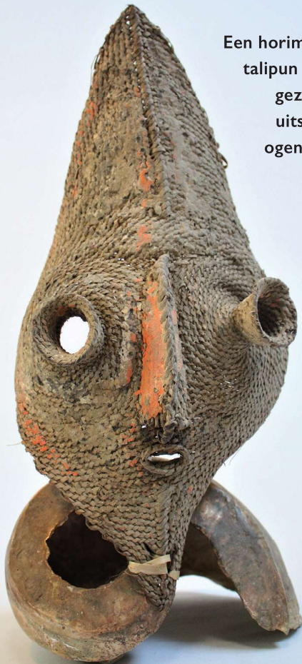
Een horimine, een talipun met een gezicht met uitstekende ogen, hoogte 36 cm