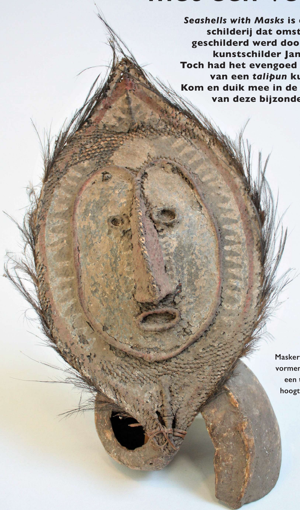
Masker en schelp vormen tezamen een talipun, hoogte 40 cm.

Kom en duik mee in de wondere wereld van deze bijzondere valuta.