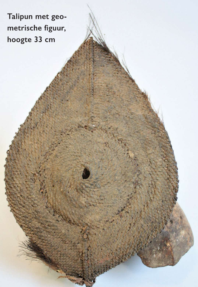
Talipun met geometrische figuur, hoogte 33 cm