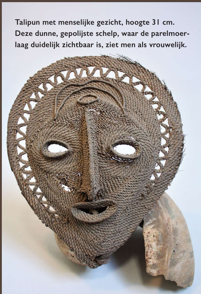
Talipun met menselijke gezicht, hoogte 31 cm. Deze dunne, gepolijste schelp, waar de parelmoerlaag duidelijk zichtbaar is, ziet men als vrouwelijk.