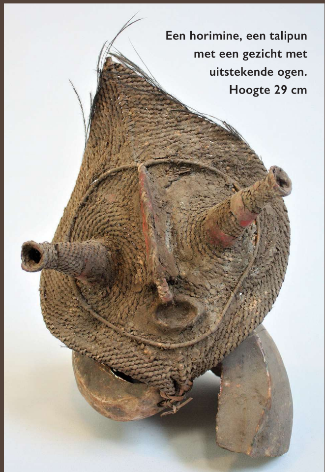
Een horimine, een talipun met een gezicht met uitstekende ogen. Hoogte 29 cm