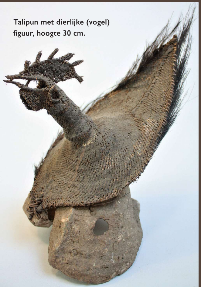
Talipun met dierlijke (vogel) figuur, hoogte 30 cm.