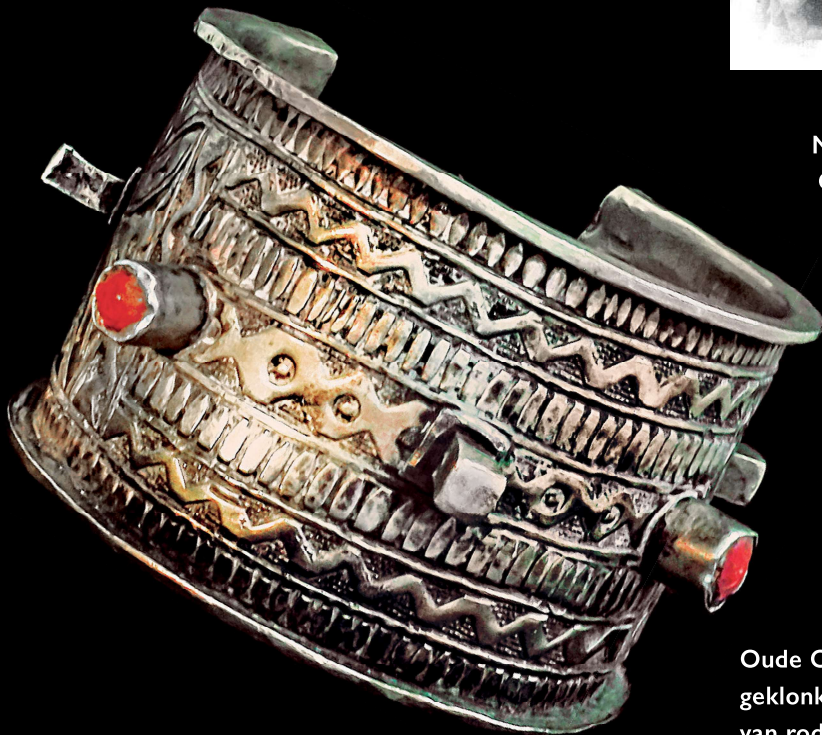
Oude Ouled Naïl armband met drie geklonken, kleine pinnen en twee cabochons van rode pasta, midden 19e eeuw