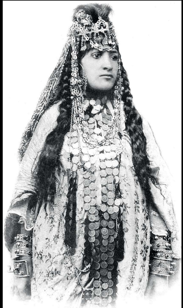
Een jonge vrouw gekleed volgens de Ouled Naïl-traditie. Aan beide polsen worden zowel Ouled Naïl-armbanden als die van de Chaoui gedragen, 1911

De vrouwen van de Ouled Naïl in Algerije worden in de Westerse wereld vaak gezien als ‘feministen avant la lettre’, stoere courtesanes die zich wisten te verdedigen. Niet in het minst komt dat door hun bijzondere armbanden. Maar klopt deze aanname?