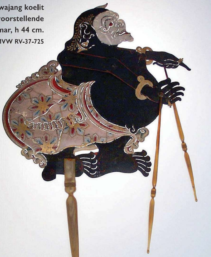
Een wajang koelit pop voorstellende Semar, h 44 cm. Coll. NMVW RV-37-725

Deze kostbare publicatie werd waarschijnlijk mede gefaciliteerd door de Nederlandse overheid die internationaal ernstig gezichtsverlies had geleden door de wrede en hardvochtige wijze waarop in Lombok en Noord-Bali de heersende klasse was vernietigd en de diverse koninklijke kunstschaten als oorlogsbuit waren afgevoerd naar Nederlandse musea, en die zo hoopte te kunnen laten zien dat ze respect hadden voor inlandse cultuurfenomenen.