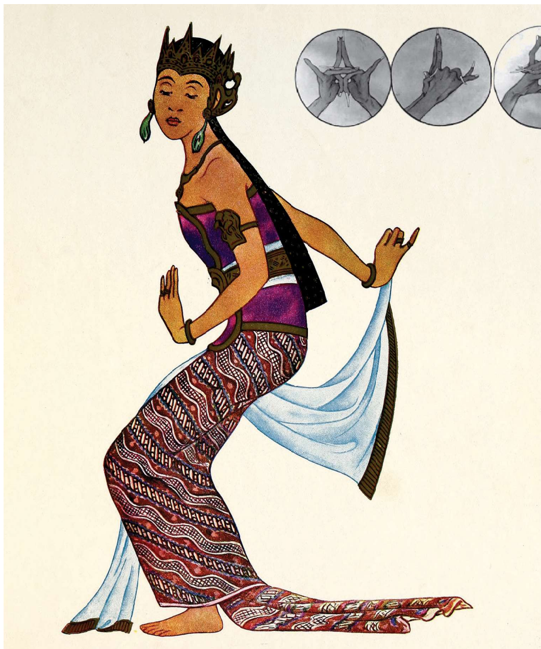
Handhoudingen van de Balinese priesters, mudra's, getekend door Tyra Kleen. Bron P. de Kat Angelino, 1922

Tyra Kleen maakte tekeningen van de bewegingen van priesters tijdens het bidden, bellen en wierookbranden