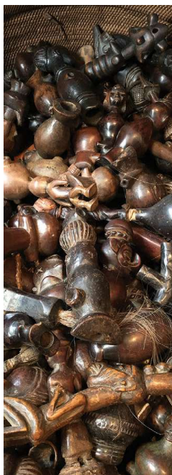
Een mand vol fluitjes van hout en ivoor.

Bepaalde groepen voorwerpen, zoals Lega stukken en Songye beelden hebben mijn voorliefde en deze zie je ook terug in onze familieverzameling. Het waarom van een bepaalde voorkeur voor zekere objecten is vaak moeilijk onder woorden te brengen, maar stuurt me wel aan.