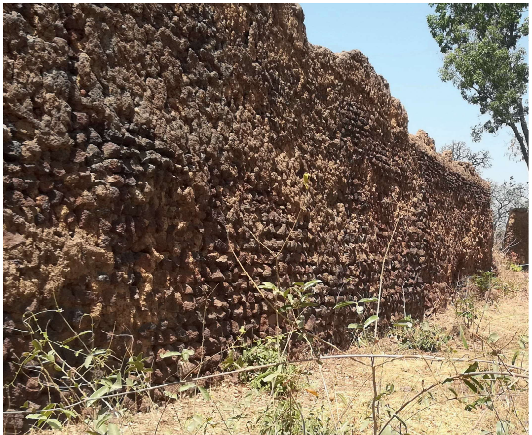
De ruïnes van Loropéni.