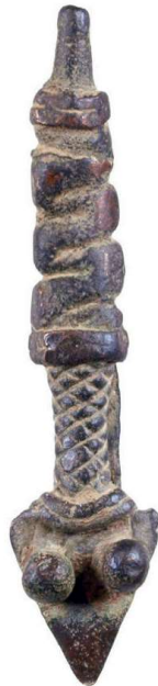
Ritueel object, ± 8cm.

literatuur beschreven dat ze zelf bronzen voorwerpen vervaardigden.