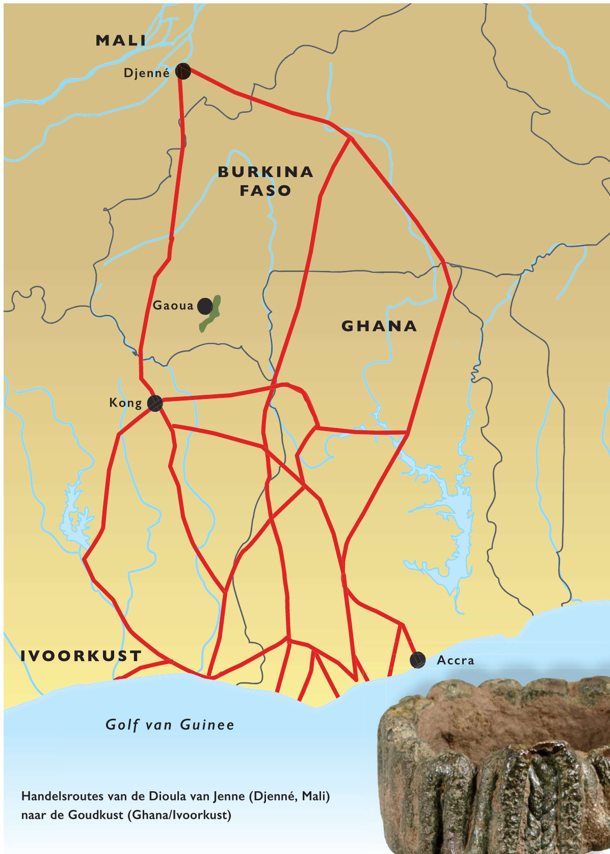
Handelsroutes van de Dioula van Jenne (Djenné, Mali) naar de Goudkust (Ghana/Ivoorkust)