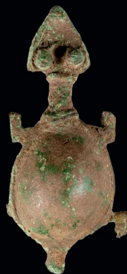
Schildpad, ± 8 cm.

Kulango brons, tegenwoordig zeer gewaardeerd bij verzamelaars, ± 5 cm.