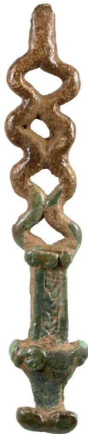
Ritueel object, ± 9 cm.