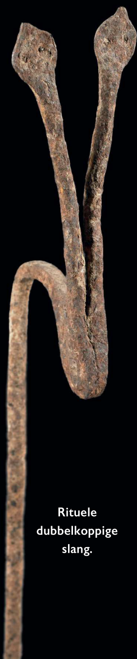
Rituele dubbelkoppige slang.

In het zuidwesten van Burkina Faso wonen een aantal volkeren, zoals de Lobi, de Kulango, de Senufo en de Gan. Deze volkeren maken in hun cultuur gebruik van bronzen voorwerpen, die gemaakt zijn volgens de verloren-was-techniek, het cire perdue procedé, lost wax casting (zie kader).