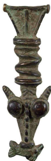
Rituele objecten, ± 8 en 10 cm.