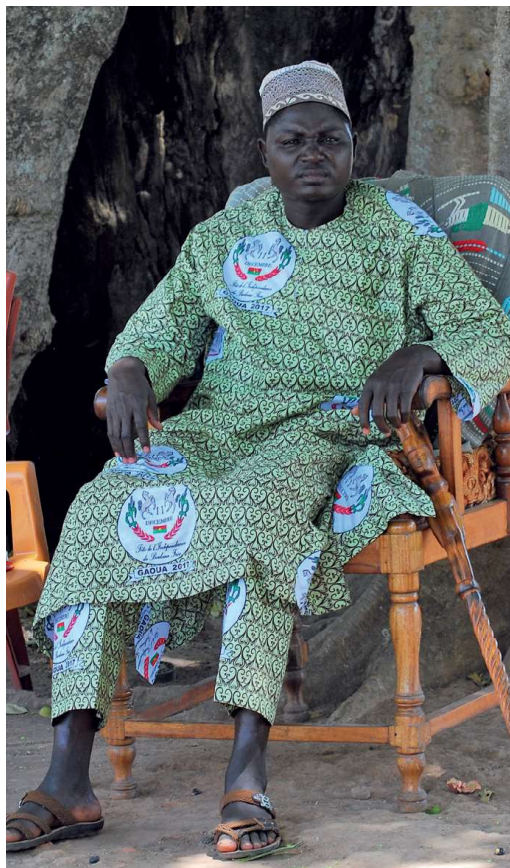
De huidige 29ste koning van de Gan, Tukpa Baton in 2018.

Toen de Gan in dit gebied aankwamen vonden ze ruïnes en putten die kennelijk gebruikt waren voor goudwinning. Met het goud werden belangrijke aankopen gedaan (geweren, munitie, slaven). Op de markt werd betaald met kauri's. Alleen de koning had enkele gouden ceremoniële voorwerpen.