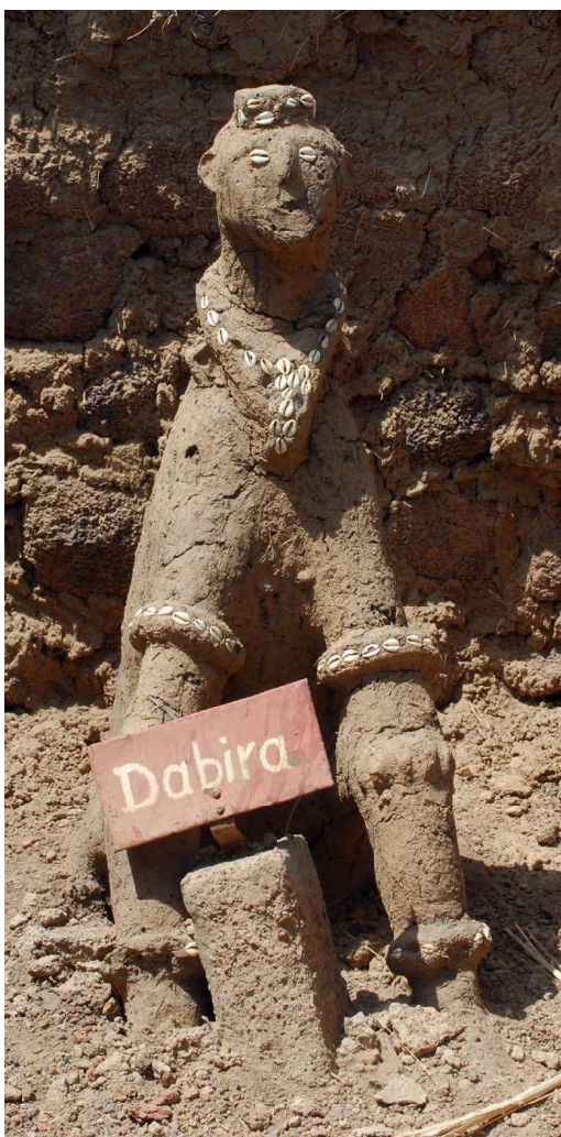
Van alle koningen, die geleefd hebben, bestaat een dergelijke afbeelding gemaakt van de modder van een termieten nest. Ze staan opgesteld in afzonderlijke gebouwtjes (altaarhutten).